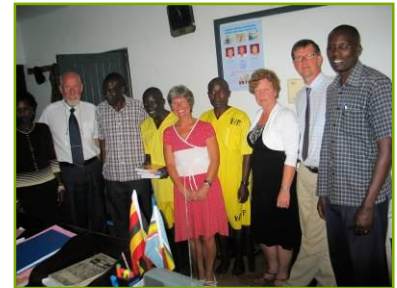
Kigo Prison project initialisatie

Heeft u contacten bij Ronde Tafel, Rotary, Lions, bij kerken, verenigingen of bij andere organisaties die goede doelen willen ondersteunen, probeer ons als doel op te laten nemen. Indien nodig kom ik graag een toelichting en presentatie houden!