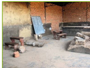
Luxe stenen 'stoelen' in de gevangenischool

Grote kerels in veel te kleine bankjes, of zittend op een stuk steen, maar die wel heel gemotiveerd zijn om te leren voor een beter leven na de gevangenis. Kigo Prison heeft twee schooltjes. Wat wij de basisschool noemen, Primary 1-7 is buiten onder een lekkend afdak en wat wij de middelbare school noemen, Secondary 1-6 bevindt zich in een hoek van de gevangenis in een vroegere doucheruimte met een stinkend riool. Velen hebben geen schoolopleiding genoten en zijn analfabeet; kortom geen toekomst. Ook hier weer een driefasen aanpak. Eerst de golfplaten daken lekvrij maken, bestaande obstakels en wandjes verwijderen, betonvloeren egaliseren, scheidingswanden plaatsen en stucwerk op de muren aanbrengen. Vervolgens houten stoelen en afsluitbare kasten plaatsen onder andere voor schoolbenodigdheden. Tenslotte opstarten van een goede studentenadministratie, het monitoren van onderhoud van bestaande faciliteiten en het opstarten van een kwaliteitssysteem. Naast gedetineerden die als 'onderwijzer' hun medege-detineerden helpen is er nu vanuit UPS een ervaren gediplomeerde onderwijzer in Kigo geplaatst; voor ons een goed aanspreekpunt. Ook voor Second Chance Support (SCS) een leerzaam project!