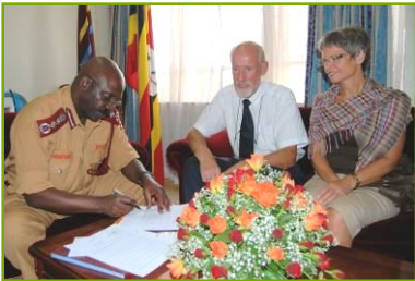
Dr. Byabashaija tekent MoU tussen UPS en SCS

Second Chance Support (SCS) heeft als eerste stap een samenwerkingsovereenkomst gesloten met Uganda Prisons Service (UPS). Daarin staat